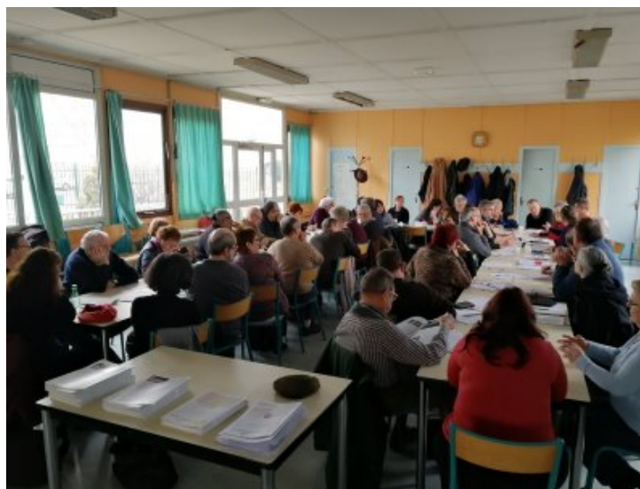
14 départements du PCF participent à la rencontre du réseau

Nous avons l'objectif avec cette réunion de nous placer à l'offensive dans la préparation du prochain congrès dit extraordinaire, de décider ensemble d'une ligne claire et partagée, de prendre les décisions d'action et de travail qui permettent à cette ligne d'être identifiée, reconnue comme utile et de rassembler.