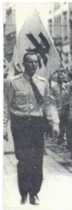
Andrii Parubii, alors l'un des leaders du SNPU